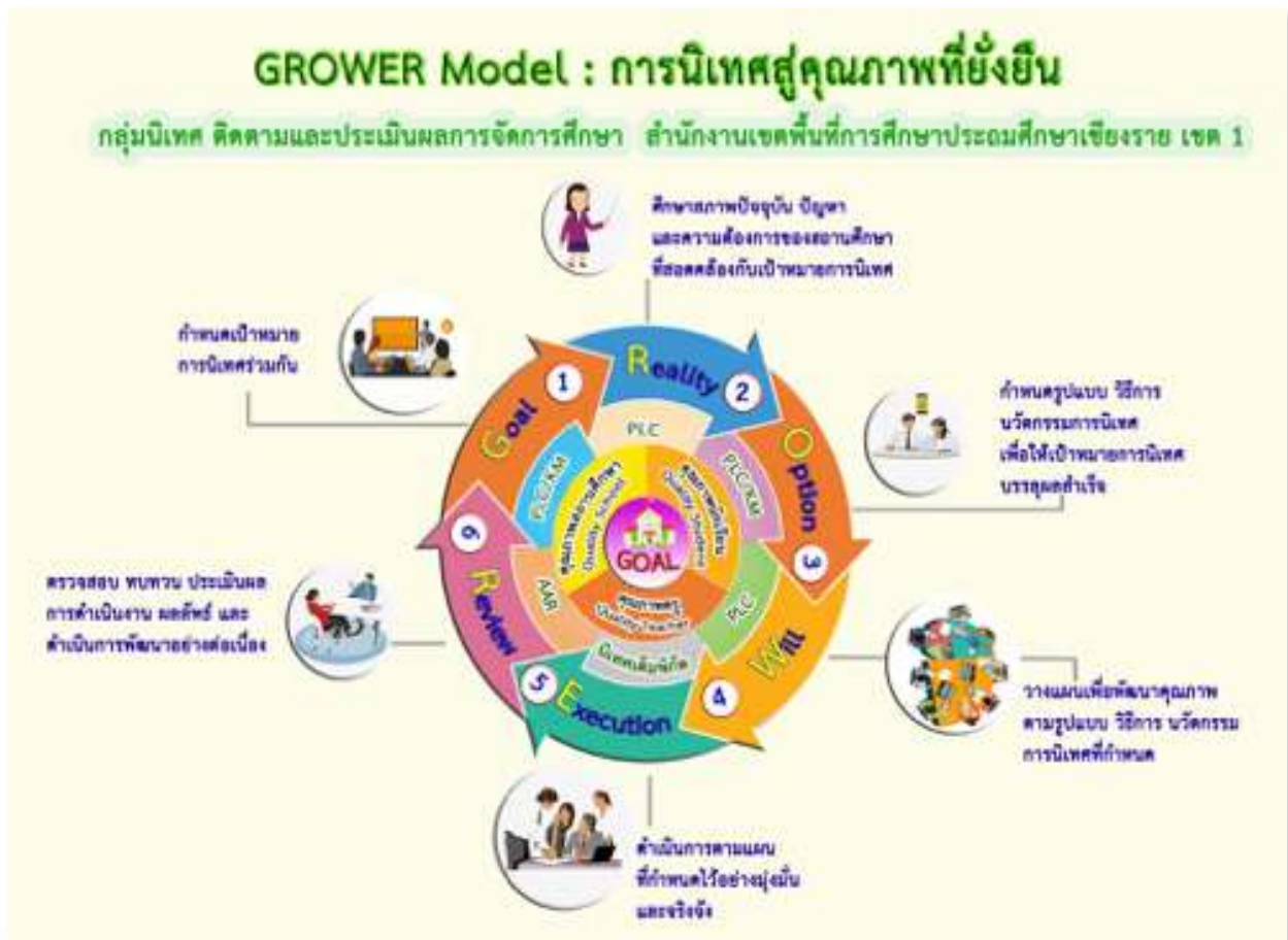
แผนภูมิที่ ๑ GROWER Model: การนิเทศสู่คุณภาพที่ยั่งยืน

กลุ่มนิเทศ ติดตามและประเมินผลการจัดการศึกษา สำนักงานเขตพื้นที่การศึกษาประถมศึกษาเชียงราย เขต ๑ กำหนดให้มีการนิเทศโดยใช้รูปแบบ “GROWER Model: การนิเทศสู่คุณภาพที่ยั่งยืน” เพื่อพัฒนาคุณภาพการศึกษาตามเป้าหมายที่กำหนดไว้ โดยมีรายละเอียดดังนี้